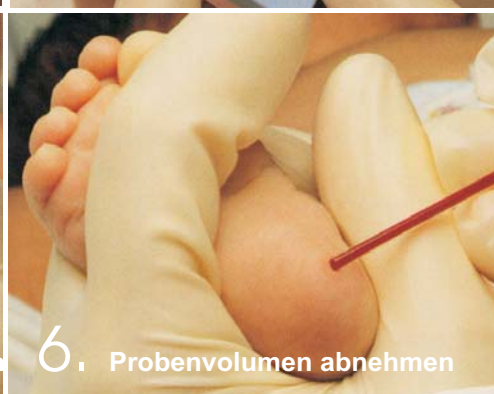
6. Probenvolumen abnehmen