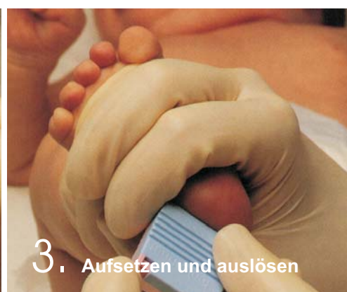
3. Aufsetzen und auslösen