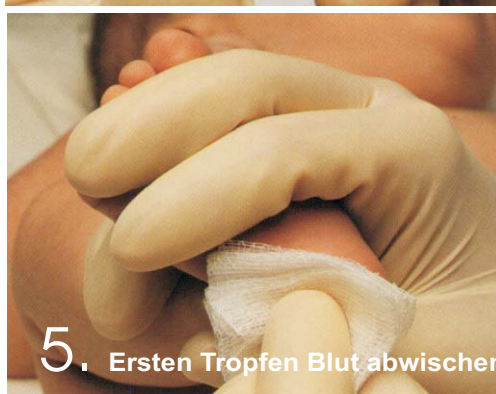
5. Ersten Tropfen Blut abwischen