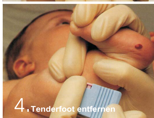
4. Tenderfoot entfernen